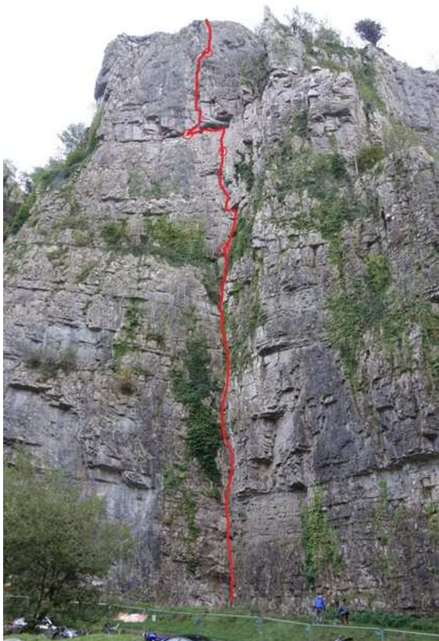
Pohled zdola + přibližná trasa výstupu